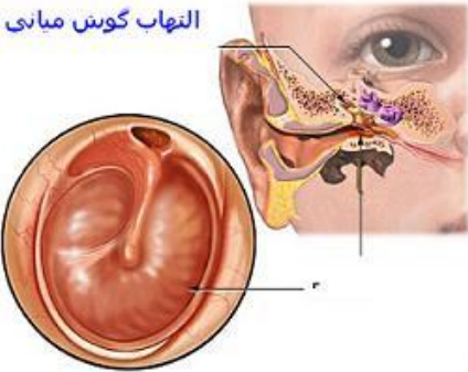
التهاب گوش میانی

به عفونت در گوش میانی که همراه با پارگی پرده صماخ بیش از سه ماه باشد، اوتیت میانی مزمن گویند. روند بیماری از سوراخ شدن پرده صماخ تا توده های وسیع عفونی می باشد.