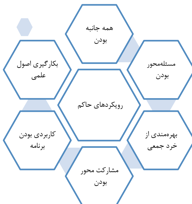
شکل ۱-۵. اصول حاکم بر برنامه

سند چشم‌انداز و برنامه استراتژیک بیمارستان با توجه به رعایت اصول ذیل تهیه شده است. این اصول مانند روح حاکم بر برنامه هستند و در حکم راهنمای کلی تدوین برنامه عمل می‌کنند.